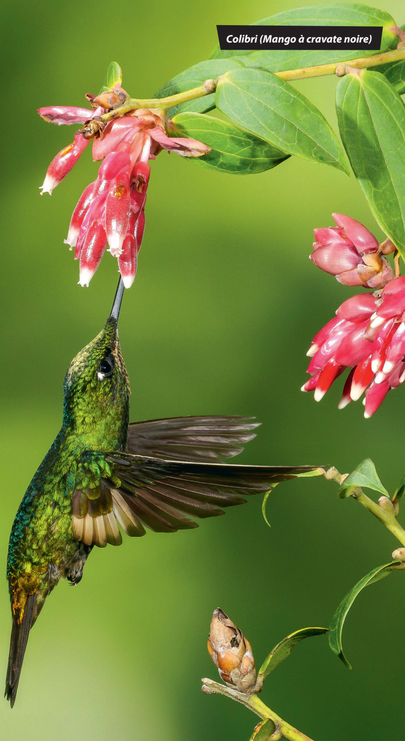
Colibri (Mango à cravate noire)